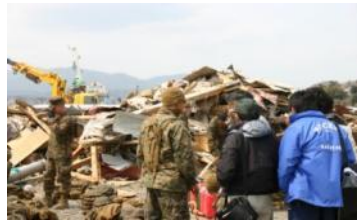
ヒアリング調査の様子

平成23年4月、上下水道施設の被災・復旧状況、飲料水の供給状況、水災害（津波）の被害状況の調査を実施。