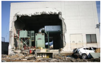
気仙沼市の終末下水処理施設

調査を踏まえて、東北・関東地方に甚大な被害をもたらした東日本大震災後の日本社会に対し、持続可能な水社会の構築に向け議論された内容をとりまとめ、関係省庁、国会議員、東北3県等に提言書を発出。