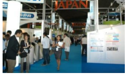
シンガポール国際水週間における日本パビリオンの様子