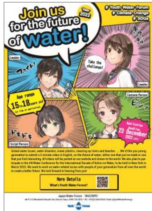
「ユース水フォーラム 2022」動画募集チラシ 左)日本語版 右)英語版