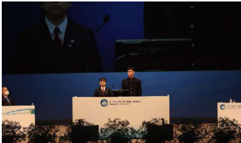
第4回アジア・太平洋水サミット開会式で、ユースによる開始宣言を行いました