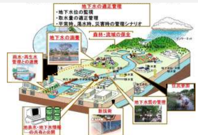
地下水マネジメントに向けた取り組みイメージ