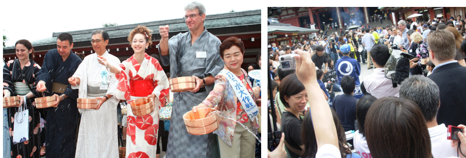
打ち水大作戦 2007 いっせい開幕打ち水の様子(東京・浅草寺) ラトビア大使、フィリピン大使ら 18 カ国 22 名の大使館関係者、 名古屋、大阪、福岡、佐賀、熊本から全国の打ち水大作戦の仕掛け人たちも参加 写真中央は、打ち水娘 Katy 700 名のいっせい打ち水で 29.1℃→28.1℃に気温が低下した。 計測：(株)CTI サイエンスシステム 計測機器：IPS 型温度センシング装置